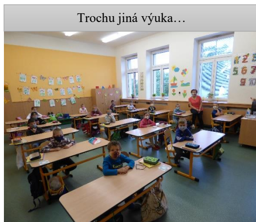
Trochu jiná výuka...

Říká se, že všechno zlé je k něčemu dobré, a jsem přesvědčen, že je tomu tak i nyní. Děkujeme všem rodičům za potřebnou podporu svým dětem při domácím vzdělávání, bez které to opravdu NEJDE. Děkujeme také těm, kteří v průběhu online vzdělávání uznali náročnost učitelské práce. Děkujeme zřizovateli školy za poskytnutí ochranných pomůcek nezbytných pro otevření školy. Děkuji všem správním zaměstnancům za jejich osobní nasazení po celou dobu platnosti mimořádných opatření. A všem přeji s nadcházejícím létem a těmi opravdovými prázdninami klid, pohodu, duševní harmonii a rovnováhu.